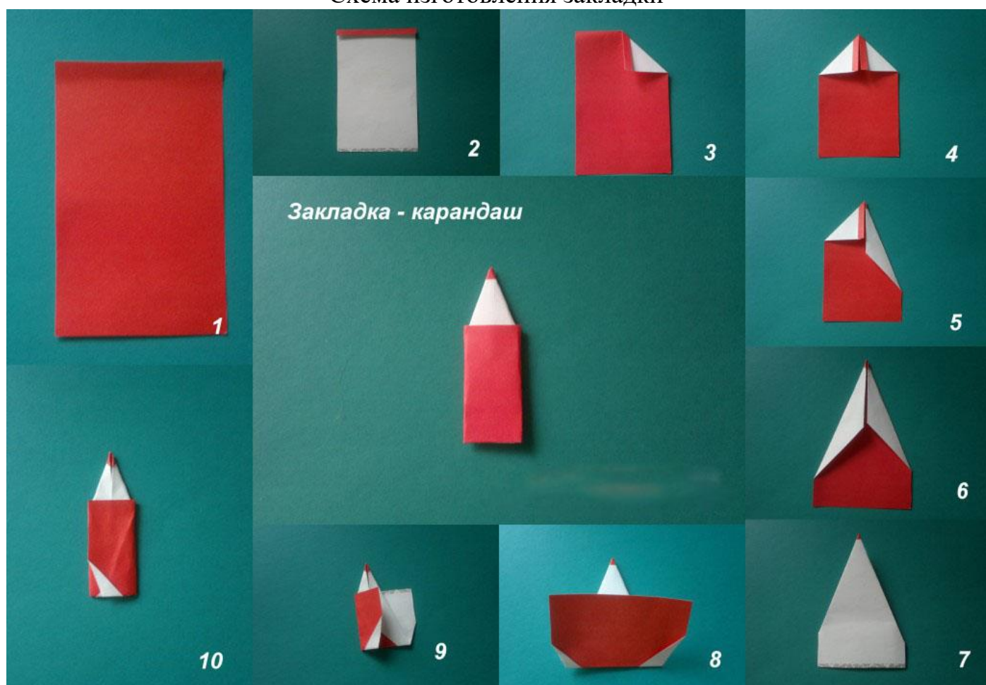
Схема изготовления закладки

Данную закладку можно изготовить и из обычной офисной бумаги, а потом раскрасить ее. Можно использовать яркие листы из журнала, кусочек обоев и т.д. Действия нужно производить поочередные, в четком соответствии схеме.